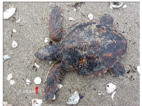
Foto 5 – 7: individui di Caretta caretta rinvenuti, rispettivamente, nei transetti 32, 5 e 13; il soggetto a destra è in vita