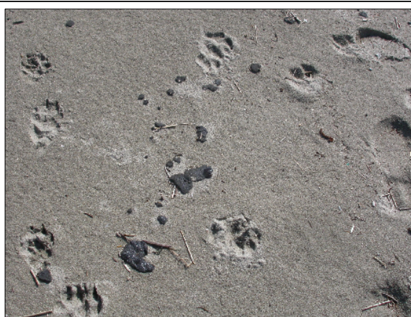
Foto 1: transetto 29, catrame in spiaggia e impronte di cani di grossa taglia

L'ispezione accurata della linea di marea (o più spesso della linea di mareggiata) ha permesso di reperire un numero di uccelli spiaggiati non molto elevato in confronto agli standard atlantici (24 in dicembre e 22 in febbraio, ossia uno ogni 13 e 11 km, rispettivamente); nessuna delle carcasse rinvenute recava segni visibili di contaminazione da petrolio, nonostante su 9 delle spiagge percorse si siano osservati accumuli notevoli di idrocarburi (a Pozzallo in entrambe le uscite, a Bellocchio, Bova Marina e Sa Plaia nell'unica uscita effettuata, a Jesolo, Selinunte, Burano, Tirrenia e Migliarino in una sola delle due: foto 1 ). La frequenza dei casi di spiaggiamento è risultata più che doppia in Adriatico rispetto ai bacini meridionali e occidentali (una