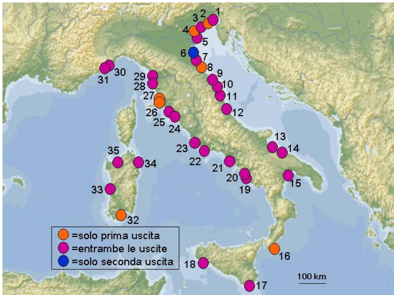
Fig. 1 – Ubicazione dei transetti costieri coperti; la numerazione progressiva corrisponde a quella della tabella 1

carcassa ogni 6.0-6.8 km in Adriatico, una ogni 18.5-48.5 km sui restanti mari), probabilmente anche in relazione all'entità assoluta delle popolazioni di uccelli marini svernanti. In diversi casi, soprattutto lungo spiagge poco antropizzate, sono stati rinvenuti solo resti delle carcasse spiaggiate, a causa dell'immediato consumo da parte di volpi; tale problema è apparso meno grave su spiagge antropizzate, anche in presenza di un numero elevato di cani di proprietà lasciati liberi sull'arenile.